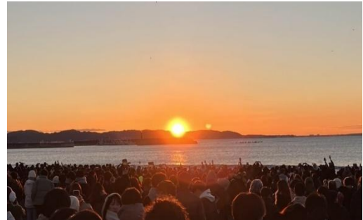
<片瀬海岸からの初日の出>

私は 40 年間エンジニアとして自動車会社に勤務してきました。これまでは会社関連の付き合いが殆どであった為、退職後は地元の方々と連携しながら、何か地元へ貢献出来る様な活動をしたと思い、自治体（藤沢市）と連携